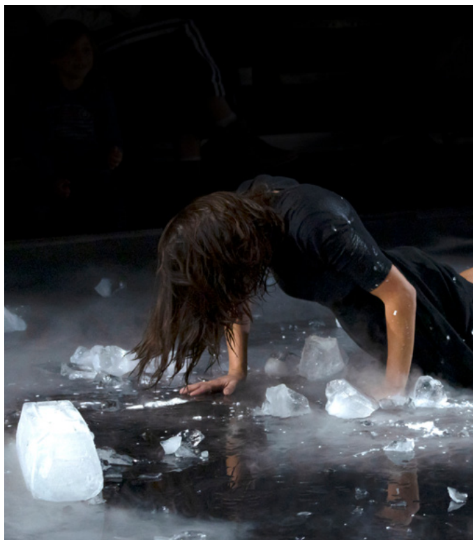
© Caterina Angeloni - El Gato Productions