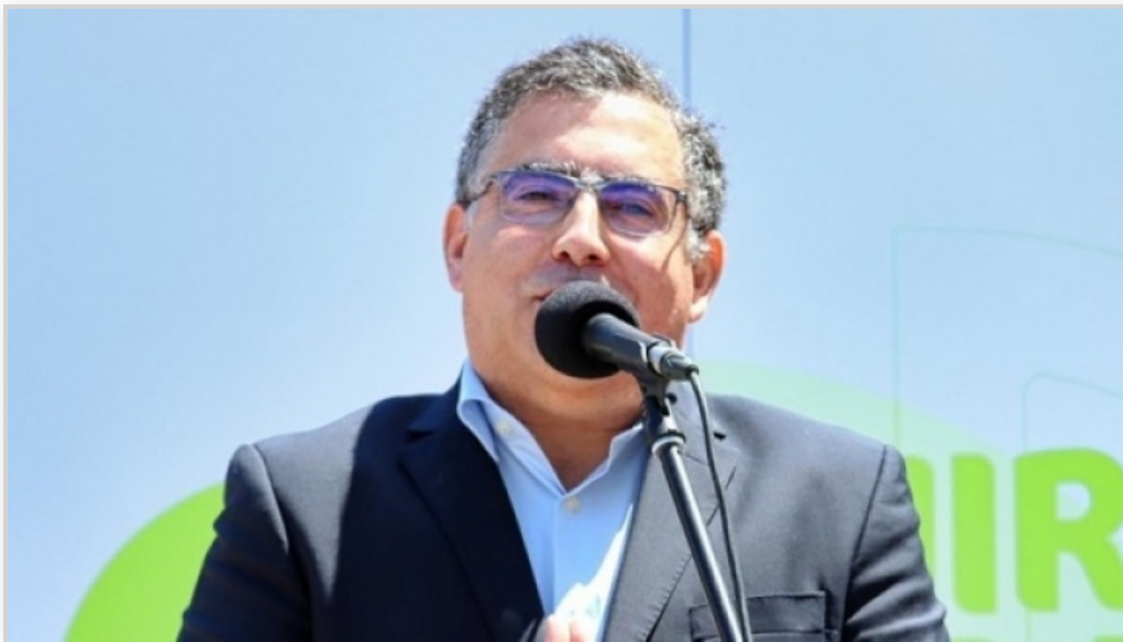
'Unir para Fazer' "atento" às movimentações político-partidárias em Ílhavo