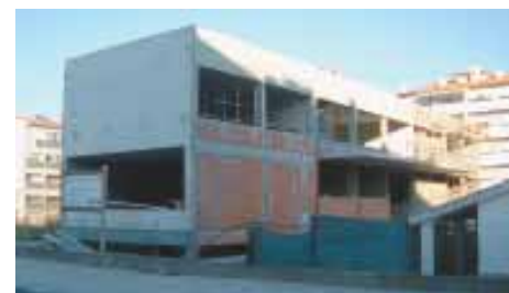
Plano e Orçamento 2003 • pág. 9