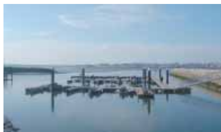
Inauguração do Cais dos Pescadores da Mota • pág. 7