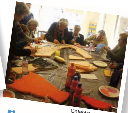
Gafanha da Nazaré