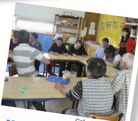
Gafanha do Carmo