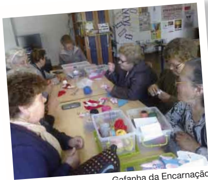
Gafanha da Encarnação

NÃO PERCA TEMPO E VENHA EXPERIMENTAR ESTES MOMENTOS FANTÁSTICOS CONNOSCO!