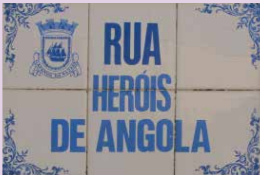
Placa toponímica na Gafanha da Nazaré.