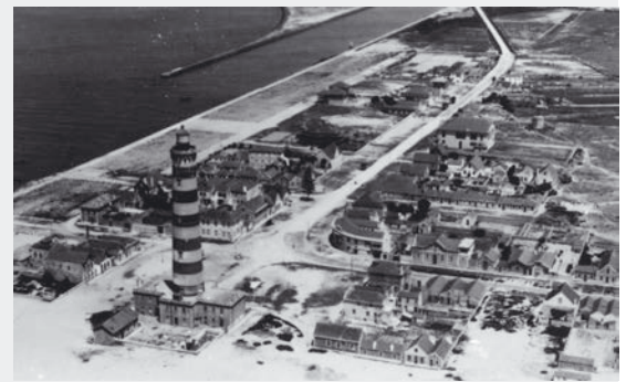
PRAIA DA BARRA – VISTA AÉREA [S.D.]

No âmbito das atividades do Centro de Documentação de Ílhavo (CDI), a Câmara Municipal pretende criar um banco de dados do Concelho, com fotografias, postais, gravuras, ilustrações, pinturas e vídeos, que alimentem memórias do passado, que complementem com imagens aquilo que da História se conhece.