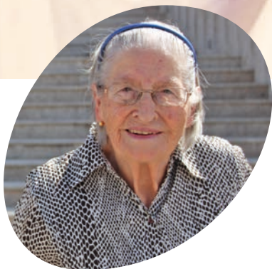
D. Esperança uma mão cheia de ternura... » págs. 8~9