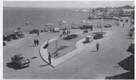
COSTA NOVA [S.D.] POSTAL EDIÇÕES ÁGUAS DA COSTA – TRUFEIRA DA FOZ, EXCLUSIVO DA PAPELARIA AVENIDA (AVEIRO)

O Centro de Documentação de Ílhavo será apenas o repositório digital que centraliza, utiliza e divulga as imagens, com a indicação dos autores e proprietários das mesmas.