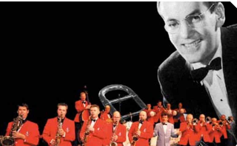
Glenn Miller Orchestra