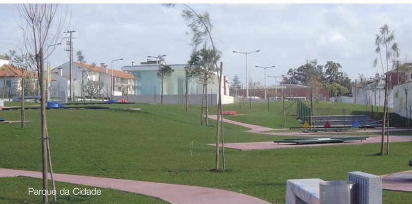
Parque da Cidade