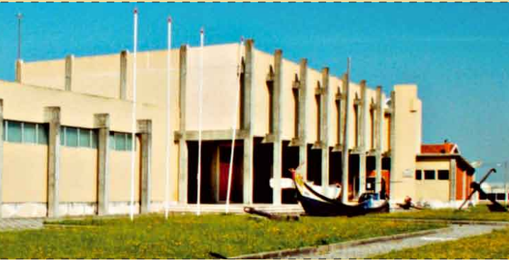
Museu Marítimo de Ílhavo

praias e Gafanhas, a conclusão dos projectos de abastecimento dos lugares da Ermida, Carvalheira e Moitinhos; o reforço da rede eléctrica no centro urbano; a inauguração da ponte entre a Vista Alegre e a Gafanha da Boavista (pondo termo à perigosa travessia através da barca de passagem), bem como a estrada entre esta povoação e a Gafanha do Carmo.