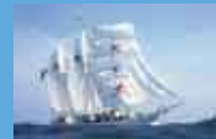
Shabab Oman (Oman)