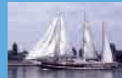
Capitan Miranda (Urugai)