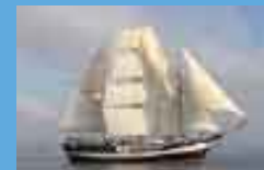
Pelican (Reino Unido)