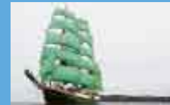
Alexander Von Humboldt (Alemanha)

Concertos Baptismos de Mergulho Insufláveis para Crianças Actividades Desportivas Parque de Diversões Mostra de Artesanato Feira de Velharias Restauração Esplanada c/ Ecrã Gigante Exposições